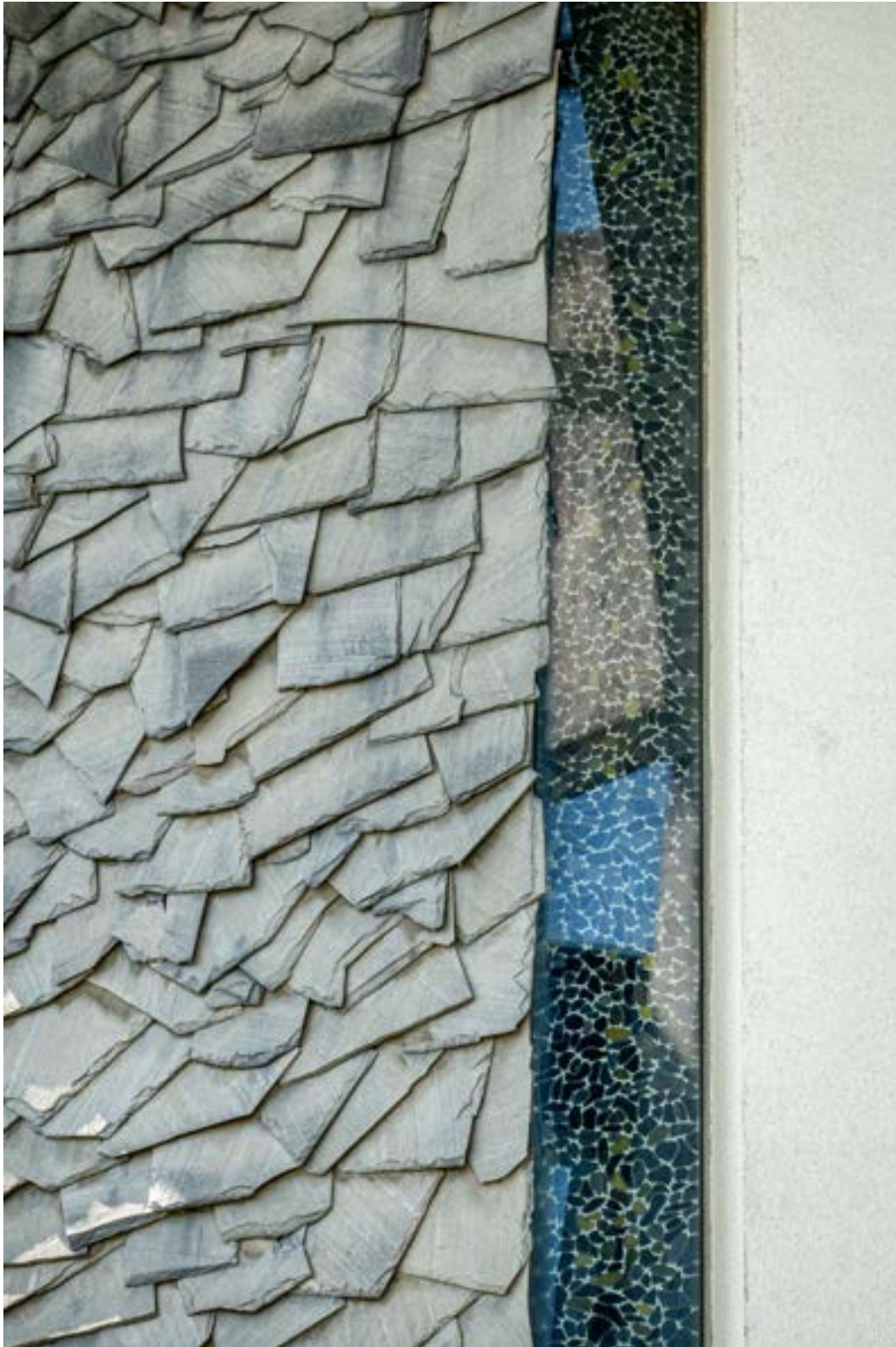
Andreas Schwarz Synagoge, Detail Sony DSC-RX100M6, 350 mm, f/6.3, 1/180 s, ISO 320