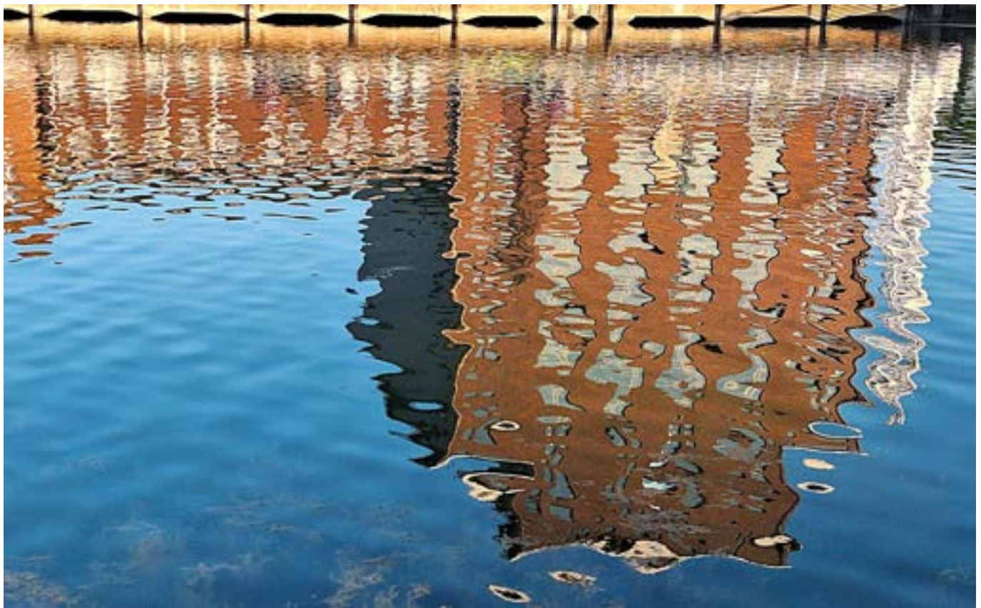
Rosi Reusch Spiegelung im Wasser Samsung Galaxy A545G, 35 mm, f/1.8, 1/368 s, ISO 40