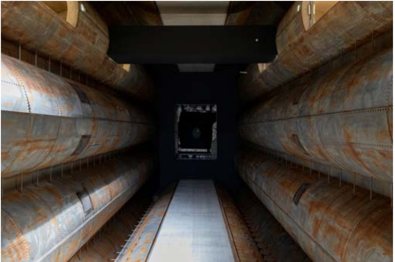
Klaus Dallinger Küppersmühle Canon R6, RF24-105 mm, 24 mm, f/5.6, 1/15 s, ISO 6400