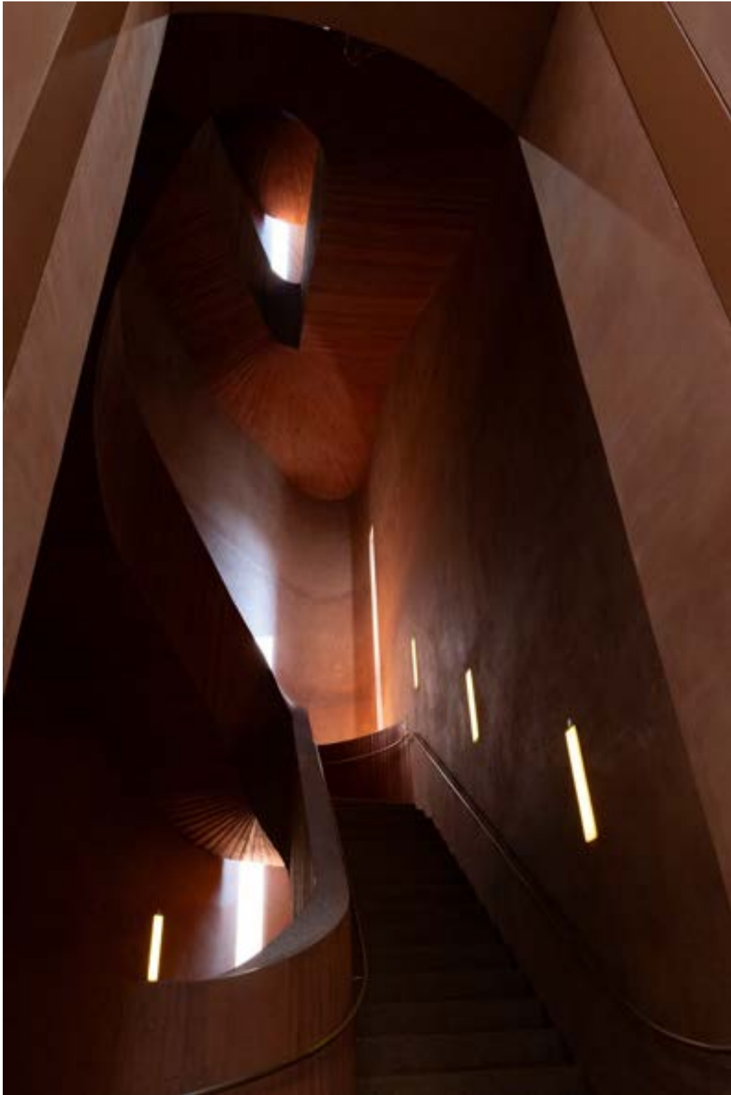
Klaus Dallinger Treppenhaus Küppersmühle Canon R6, RF24-105 mm, 24 mm, f/5.6, 1/160 s, ISO 4000